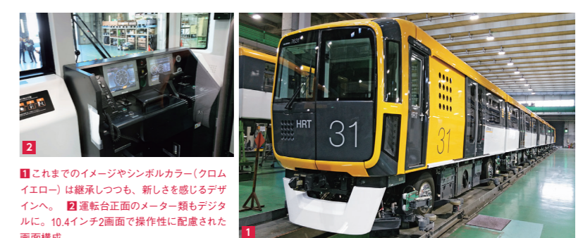
1 これまでのイメージカラー(クロムイエロー)は継承しつつも、新しさを感じるデザインへ。 2 運転台正面のメーター類もデジタルに。10.4インチ2画面で操作性に配慮された画面構成。

アストラムラインの新型車両1編成(6両)が10月4日、車両基地に搬入された。現在の全24編成を10年以上かけて新しい車両に入れ替える予定の第1弾で、検査や試運転などを重ね、来春デビューする予定。新型車両は車体をアルミ製にして軽量化し、走行に必要な電力量を減らすなどして省エネ性をUP。さらに車椅子やベビーカーでも使いやすいフリースペースを増やすなど、バリアフリーに考慮。デビューの日程は決まり次第ホームページ ( http://astramline.co.jp/ )へUP予定。